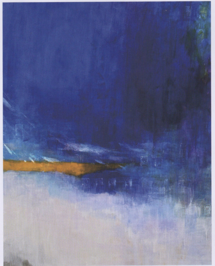
青の記憶 100F 油彩