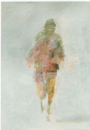
深井克美《ランナー(未完)》1978年 当館蔵