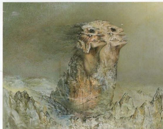
深井克美《旅への誘い》1975年 当館蔵