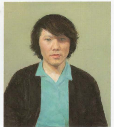
深井克美《自画像》1970年 当館蔵