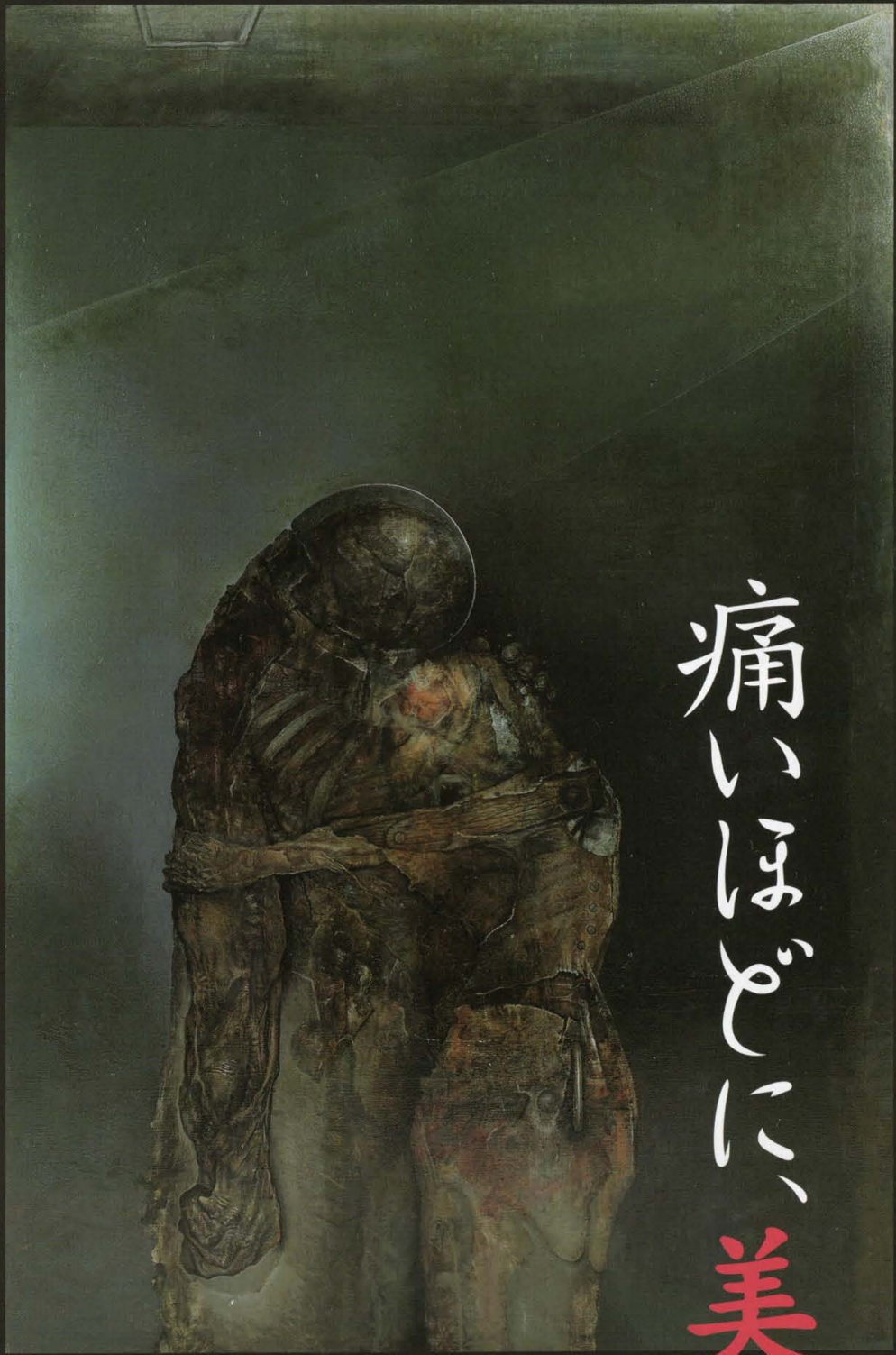
深井克美《オリオン》1977年 秋山コレクション